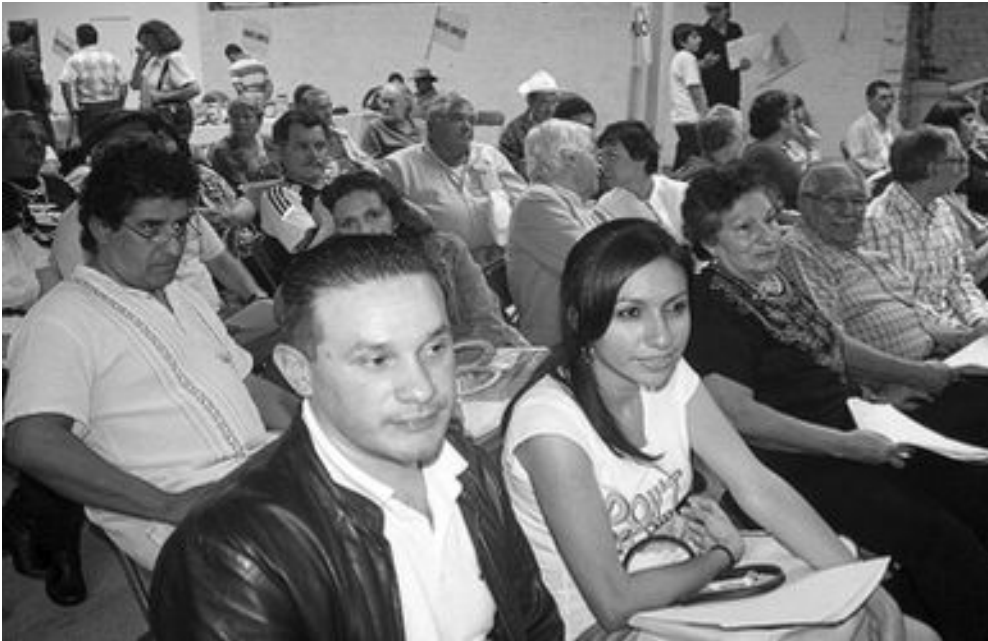
Gran participación de dirigencia de nuestro partido en todo el país.