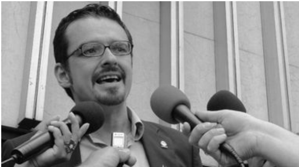
Diputado José María Villalta Florez-Estrada

El diputado José María Villalta, emplazó al Ministro de Obras Públicas y Transportes, Francisco Jiménez, para que explique por qué el Consejo Nacional de Vialidad (CONAVI) y no la concesionaria de la carretera San José –Caldera, Autopistas del