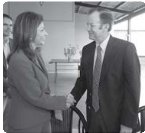
El Pacto Solís-Chinchilla, del 7 de septiembre, para aprobar a golpe de tambor el plan fiscal del gobierno. Apretón de manos para descargar el peso de la crisis en los sectores medios y populares.

Muchas interrogantes que, sin duda, han movido el tablero político en el país y que marcan una inflexión importante.