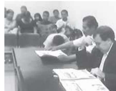
Compañeras y compañeros luchadores de Keköldi esperan el veredicto leyendo las páginas de PUEBLO

entidades efectuar los estudios y trámites necesarios para expropiar o reubicar a los no indígenas que residen ahí. Sin embargo, también insistieron en que “la obligación de recuperar terrenos en territorios indígenas que no estén siendo ocupados por personas indígenas viene impuesta por convenios internacionales como el 169