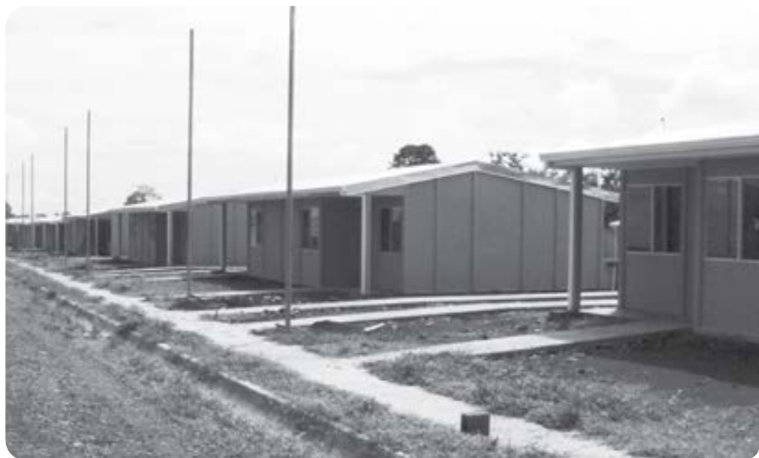
El pacto fiscal impulsado por el gobierno, con el apoyo del PAC, encarece la construcción de viviendas de interés social. Impuestos a las viviendas de los pobres y sectores medios, mientras los grandes banqueros siguen haciendo clavos de oro.

Una vez más, los tecnócratas al servicio del capital se salen con la suya, esta vez con la ayuda de Ottón Solís... “cosas veredes Sancho” ■