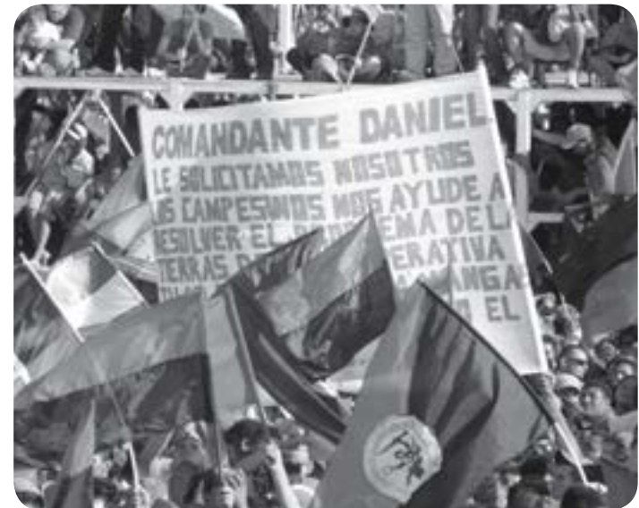
El Frente Sandinista de Liberación Nacional obtuvo la victoria en las elecciones presidenciales en Nicaragua. Contó con un apoyo de cerca del 60%

Ello no significa que deba dársele un cheque en blanco al mandatario, pero lo